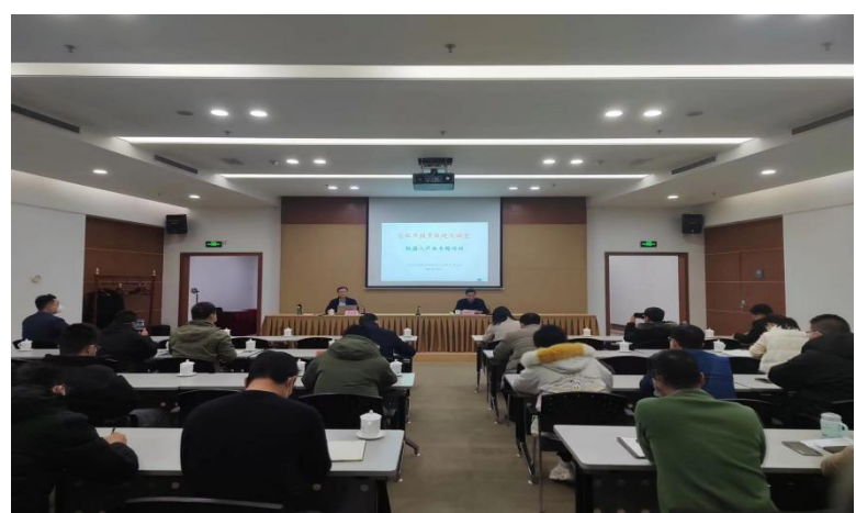
合肥市机器人产业招商引资培训