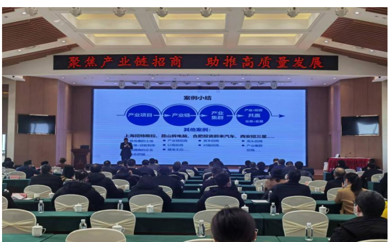
汉中市大数据招商培训