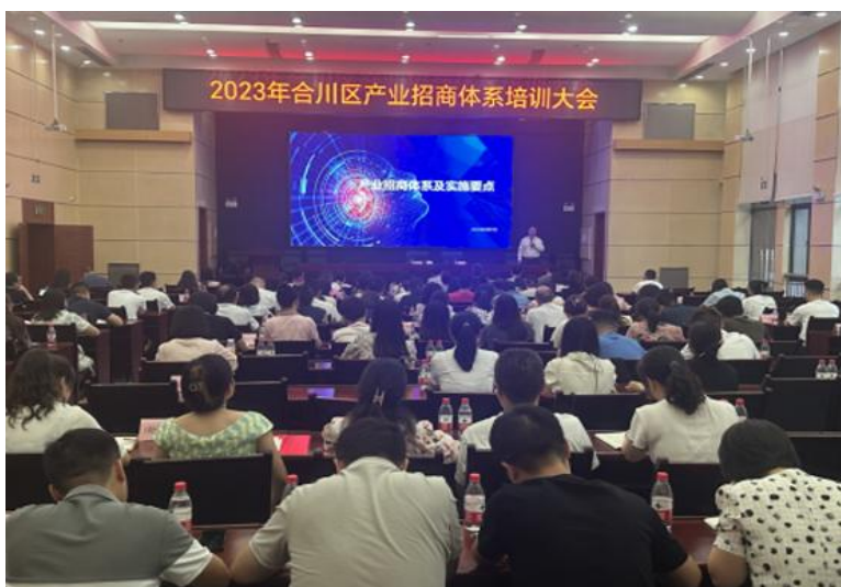
中投顾问携手重庆合川区，助力合川产业招商再上新台阶