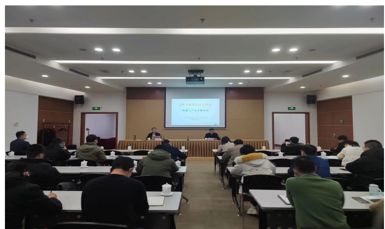
合肥市机器人产业招商引资培训