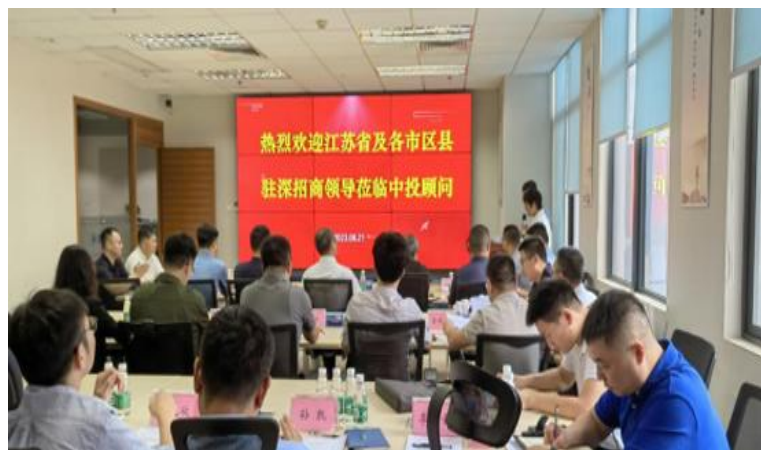
中投顾问承办江苏省全省各市区县驻深办专题招商培训