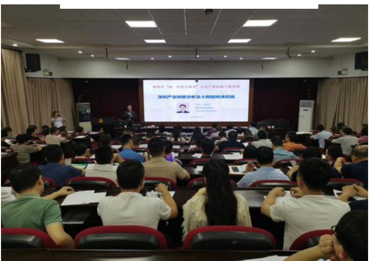
中投顾问大数据精准招商课，走进叶帅家乡梅州市