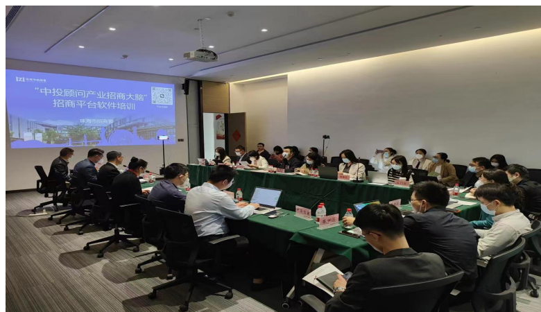
珠海市产业招商大脑使用及招商引资培训