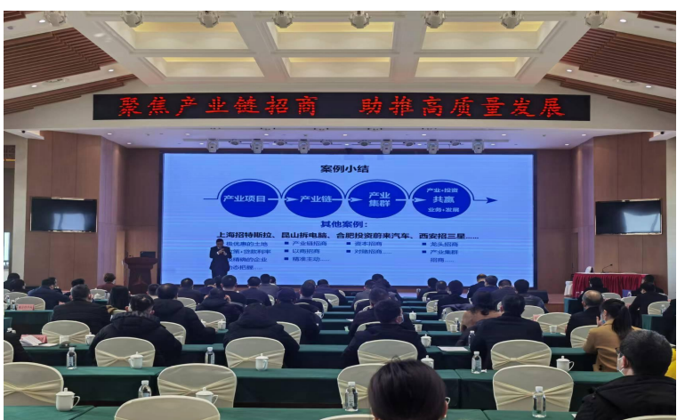
汉中市大数据招商培训